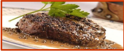
Peppercorn Fillet Steak