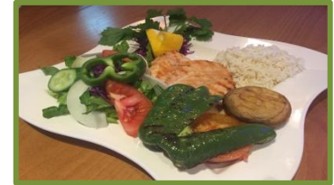
Grilled Chicken Fillet

Όλα τα πιο πάνω πιάτα σερβίρονται με βραστά χόρτα και πατάτες τηγανιτές ή πατάτα του φούρνου ή ρύζι