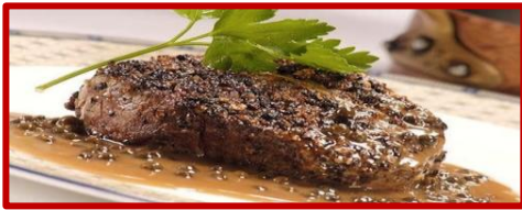
Филе Стейк Пепперкорн