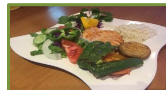
Курица на Гриле

Все блюда подаются с гарниром на выбор: жареная картошка, запеченый картофель или рис с овощами The above dishes are served with vegetables and a choice of either chips, baked potato or rice